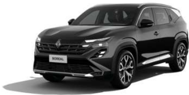
COTAÇÃO DE VEÍCULO SEXTA-FEIRA, 7 DE NOVEMBRO DE 2025