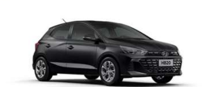
COTAÇÃO DE VEÍCULO SEXTA-FEIRA, 7 DE NOVEMBRO DE 2025