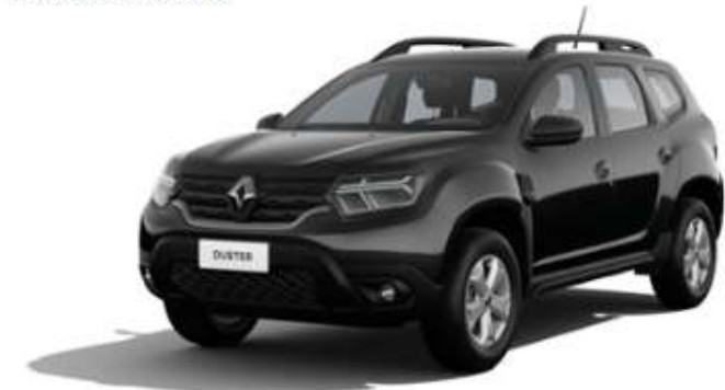
COTAÇÃO DE VEÍCULO SEXTA-FEIRA, 7 DE NOVEMBRO DE 2025