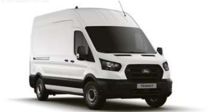
COTAÇÃO DE VEÍCULO SEXTA-FEIRA, 7 DE NOVEMBRO DE 2025